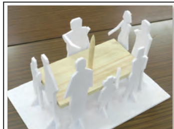
No 168 作品名 みんなでやタイ〜本杉支え愛〜 作者 チーム菊池 佐藤忠文・松田公伸・丹波秀朗 松本隆男・高木敬二・藤原恵洋・高倉貴子