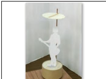
No 166 作品名 カラ・桶・やタイ 作者 チーム・ぼっち (原章・高見沢仁志)