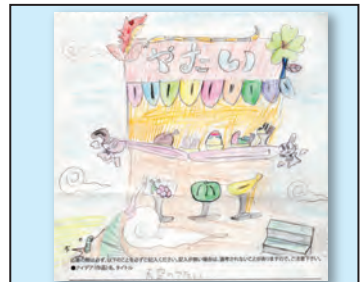
作品名 天空のやたい 作者 富山 久瑠実 (山本小・5年)