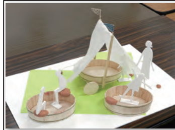
No 133 作品名 あしたからOK!! 作者 みやだら三姉妹 (工藤登紀子・崎田真央・吉武春美)