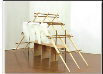
No 158 作品名 結杉 作者 吉野やままち (石橋輝一・笈浩石・内田利恵子・坂田かおり)