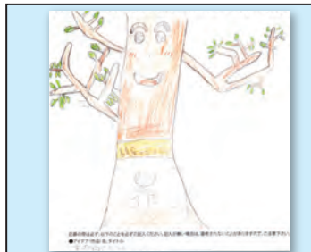
作品名 木の中のやたい 作者 間野 壱晴 (恒久小・5年)