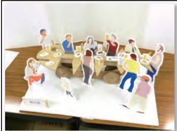
No 092 作品名 屋台骨 作者 貴志 泰正