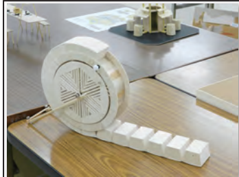
No 100 作品名 大車輪やタイ 大(だい)・コロー 人(ひと)×人(ひと)びったん 作者 田村 浩一