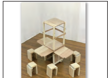
No 177 作品名 Tawari 作者 Jang Jae-Young