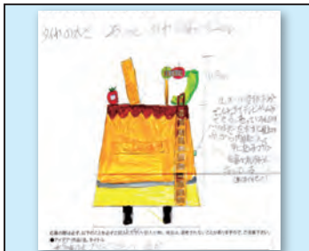
作品名 移動式プリンアラモード屋台 作者 山下 雄史 (恒久小・6年)